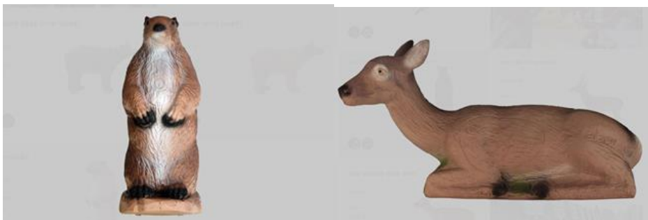
VELIKOST ZÓNY 2