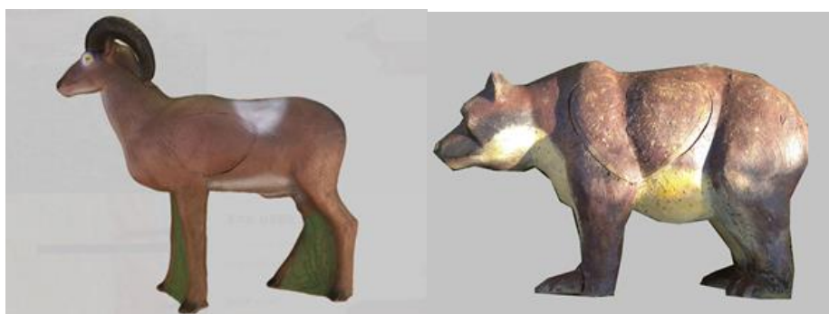
VELIKOST ZÓNY 1